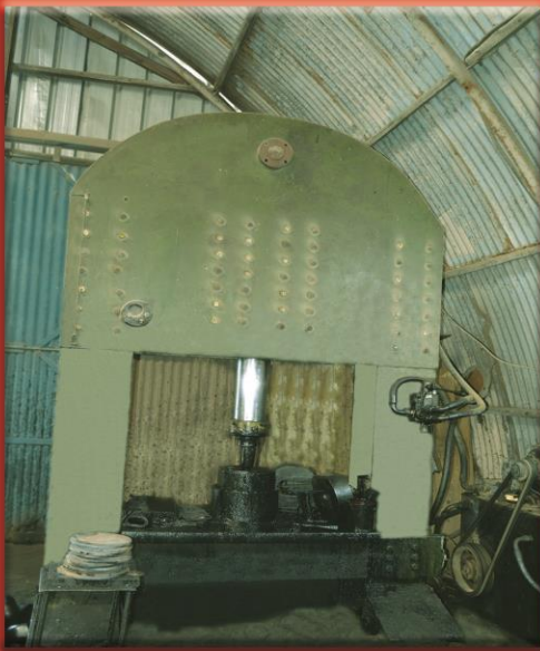
400 Ton Press Machine