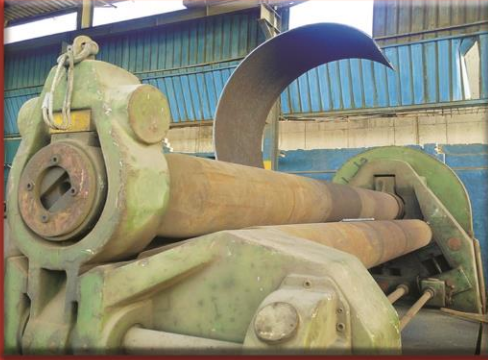
Large Sheets Rolling Machine