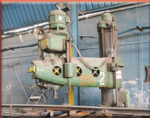
Step Drill Bit