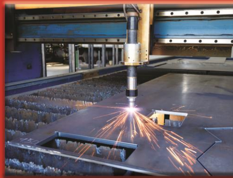
CNC Plate Cutting( 2.5x12 Meter ) ( Plazma & Oxy fuel )