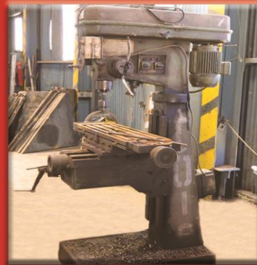
Multi Use Medium Drill