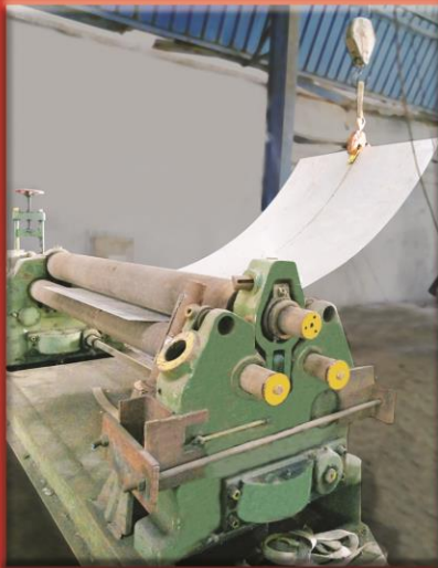
Medium Sheets Rolling Machine