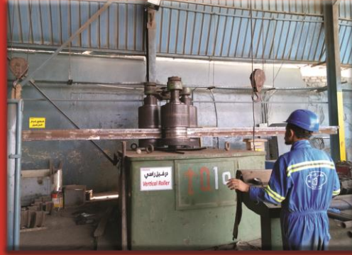
Profile Rolling Machine ( Beams , Angles , Pipes )