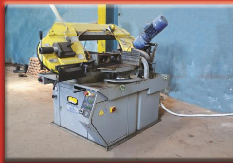
Saw Zall ( profiles & Pipes Cutting )