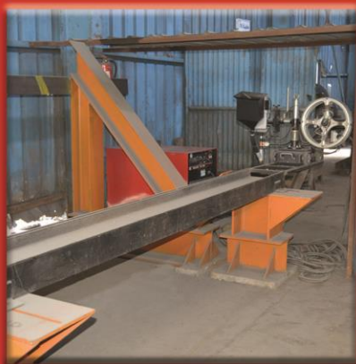
Submerge Automatic Welding Machine ( For Builtup Welding ) Legnth 18 meter